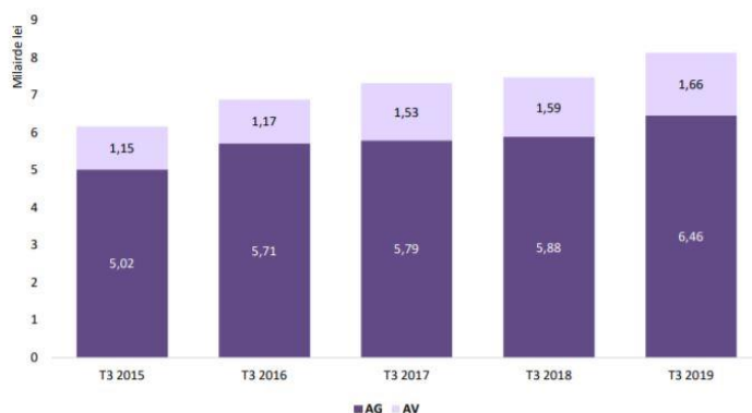
Figura 6 Evoluția volumului de prime brute subscrise în primele 9 luni aferente perioadei 2015 – 2019

Piața asigurărilor generale rămâne dominată de asigurările auto, astfel încât acestea, incluzând clasa A3 (Asigurări de mijloace de transport terestru, altele decât cele feroviare) și clasa A10 (Asigurări de răspundere civilă auto, inclusiv răspunderea transportatorului) reprezintă aproximativ 72% din totalul primelor brute subscrise pentru activitatea de asigurări generale și 58% din totalul primelor brute subscrise de societățile de asigurări în primele 9 luni ale anului 2019.